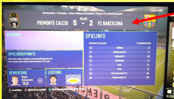
Bild mit Ergebnis

Achtung: Die Turnierleitung ist nicht dafür Verantwortlich die Ergebnisse auf Richtigkeit zu prüfen. Meldet ein Spieler das Ergebnis obliegt es dem Gegner diese Meldung zu prüfen. Kommt keine Einwände, gilt das Ergebnis als „richtig“.