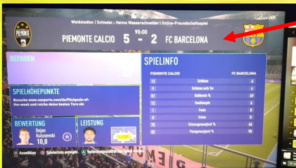
Bild mit Ergebnis